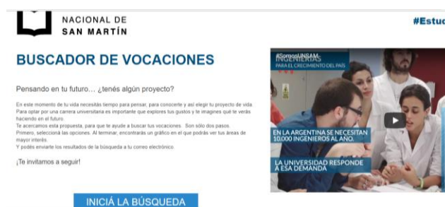
Fig. 2. Pantalla del buscador de vocaciones de la Universidad de San Martín