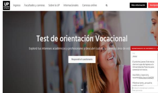
Fig. 3. Test de Orientación Vocacional