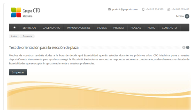
Fig. 4. Test de Orientación Especialidad

La encuesta evalúa tanto los aspectos personales como los profesionales del alumno. A través del enlace http://postmir.grupocto.es/Encuesta , es posible acceder a la encuesta, como lo indica la Figura 4.