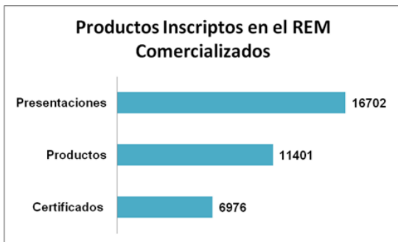
Gráfico con el detalle de presentaciones de unidad de venta, productos con sus distintas formas farmacéuticas y concentraciones autorizadas y la cantidad de certificados que representan.

Para la implementación del VNM fue necesario proceder a la estandarización de datos tales como: nombre genérico es el IFA que corresponde a la Denominación Común Argentina (DCA); se generaron listados cerrados para los excipientes, las formas farmacéuticas, unidades de medidas y vías de administración. Estos listados se actualizan cuando la evidencia científica así lo amerita.