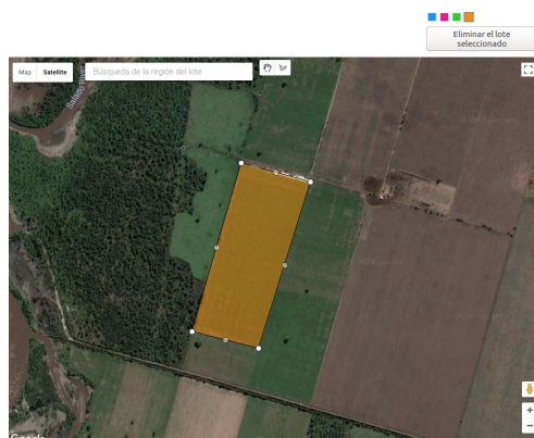
Fig. 3. Georreferenciación de lotes mediante GoogleMaps.