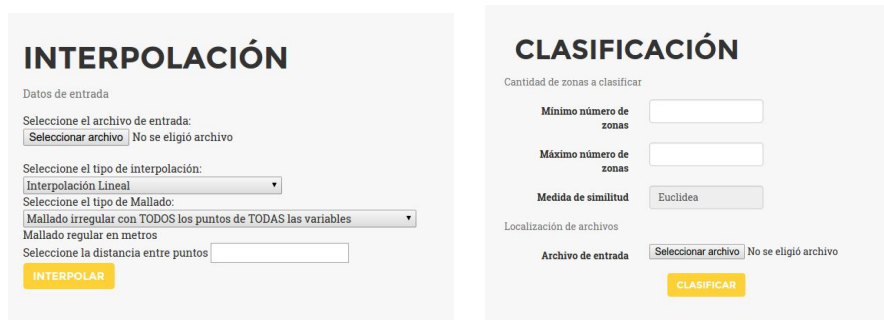
Fig. 2. Capturas de pantallas de configuración del análisis.

En la Figura 2 se ven ejemplos de pantallas del sistema web, mediante las cuales el usuario ingresa los datos de campo e imágenes, así también como los parámetros que necesita el método para la zonificación (valores por defecto son sugeridos al usuario).