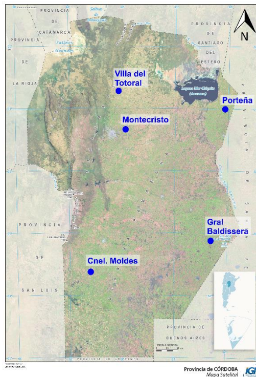
Fig. 1. Ubicación de las estaciones meteorológicas empleadas en este trabajo (realizado a partir del mapa satelital de Córdoba de IGN).

Se utilizaron datos de radiación solar de cinco estaciones meteorológicas ubicadas en la provincia de Córdoba (Figura 1). Las mismas pertenecen a la red de estaciones meteorológicas de la Bolsa de Cereales de Córdoba, y entre otros datos, registran radiación solar a intervalos de 10 minutos. Los valores fueron descargados del Sistema de Integración y Validación de Información Meteorológica, perteneciente al Ministerio de Agroindustria de la Nación ( http://sivimet.magyp.gob.ar/GISWEB/ ). A partir de estos se calcularon los valores diarios de radiación ( Wm^{-2} ) para el periodo 01/01/2016 (día 1)–31/07/2017 (día 577).